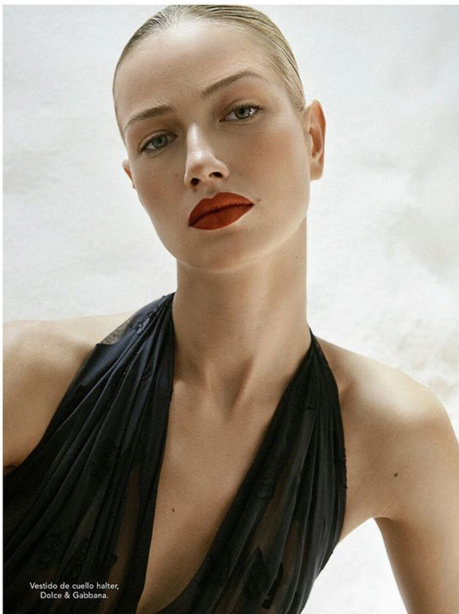
Vestido de cuello halter, Dolce & Gabbana.