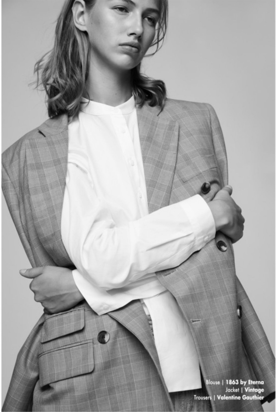
Blouse | 1863 by Eterna Jacket | Vintage Trousers | Valentine Gauthier