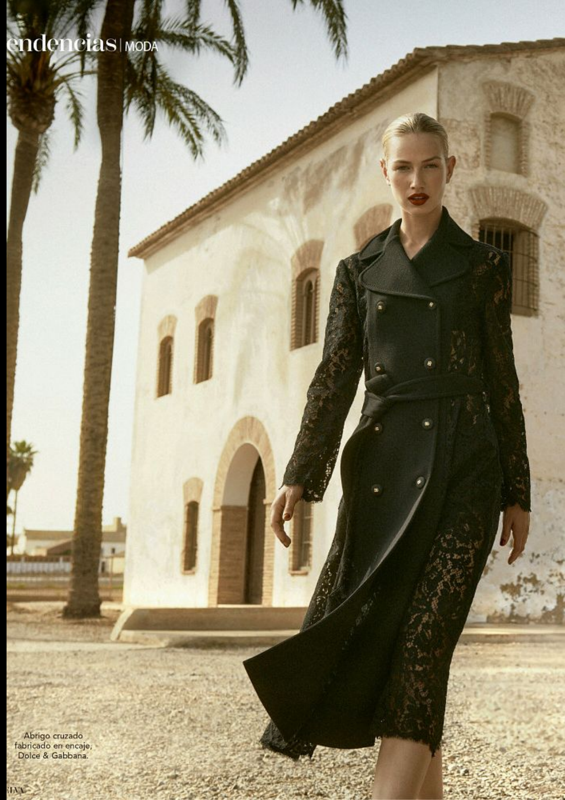
Abrigo cruzado fabricado en encaje, Dolce & Gabbana.