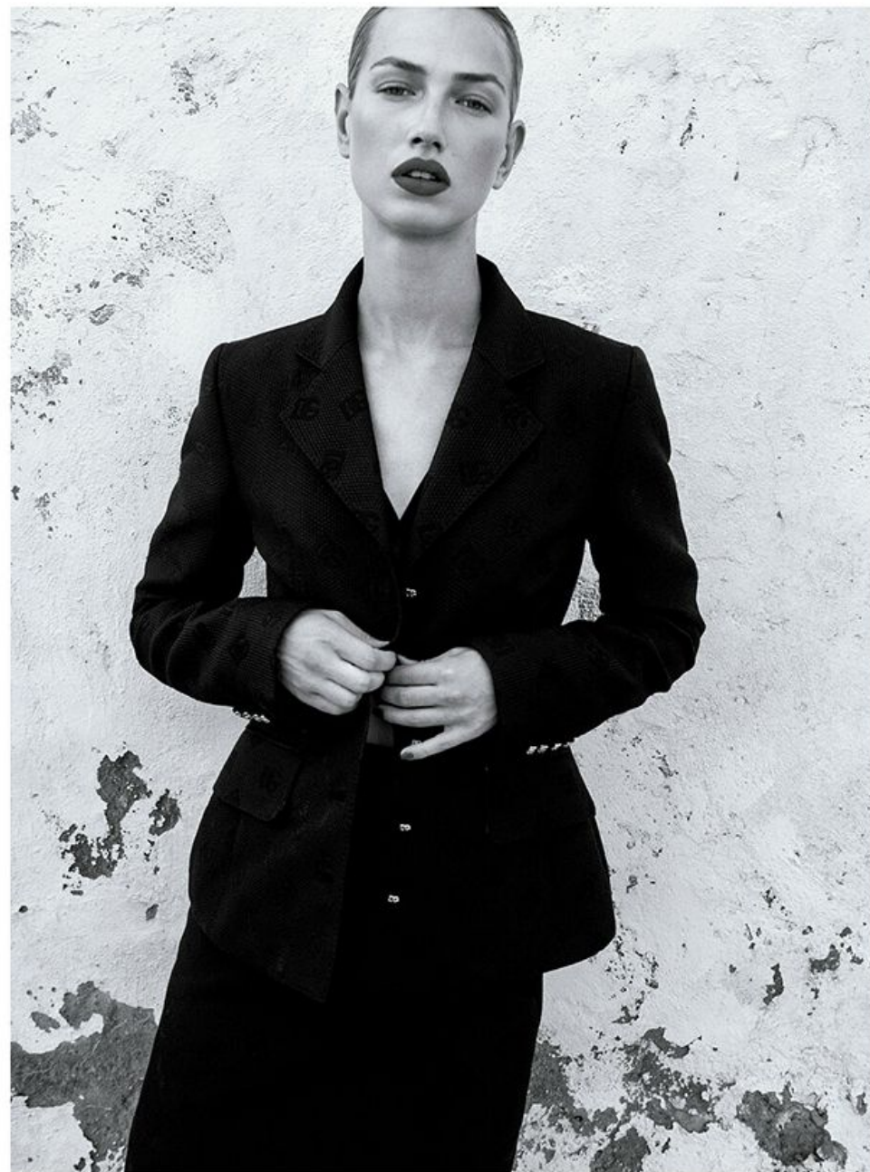
Conjunto sastre con botonadura y top lencero, Dolce & Gabbana.

Maquillaje y peluquería: Cynthia de León (COOL) para Dolce & Gabbana Beauty. Modelo: Hanny P (Line Up Models).